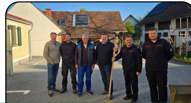
Spatenstich Zubau FF-Oberfeistritz