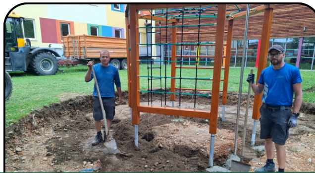
neue Spielgeräte in der VS-Anger