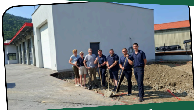
Spatenstich Zubau FF-Anger