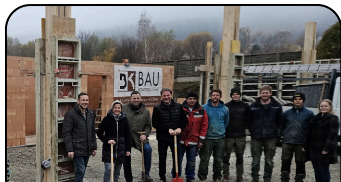
Spatenstich 3. Haus im Lindengarten