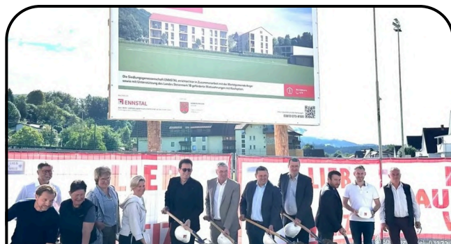
Spatenstich Wohnungen Pettauerstraße