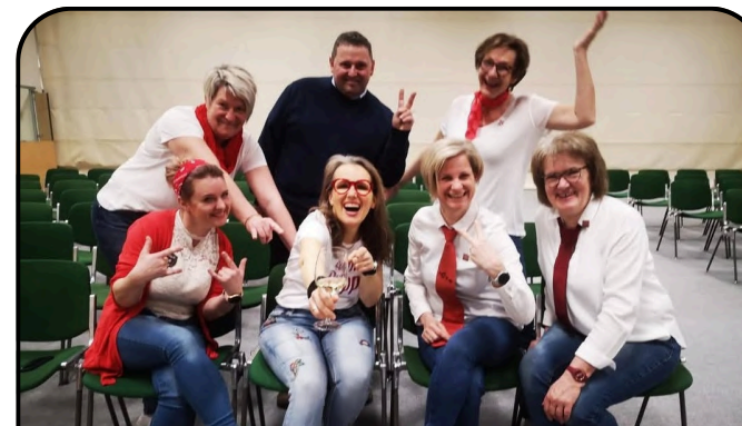
Betty-O in Anger