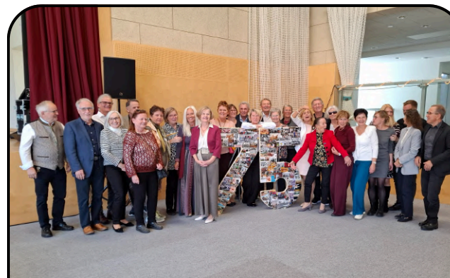
75 Jahre Mittelschule Anger