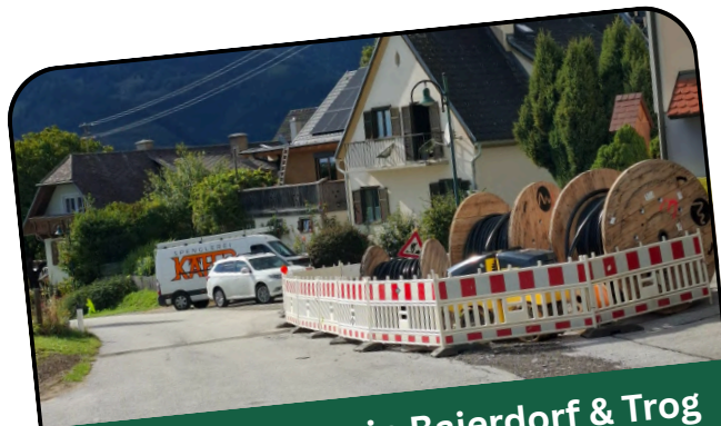
Glasfaserausbau in Baierdorf & Trog