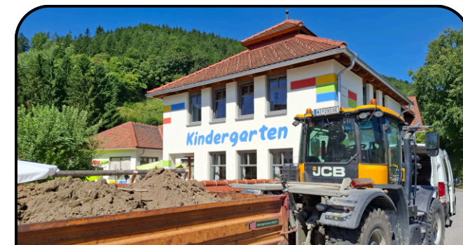
neuer Spielplatz KIGA Anger