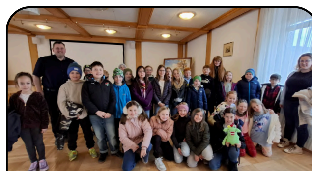
Schüler treffen Gemeinde