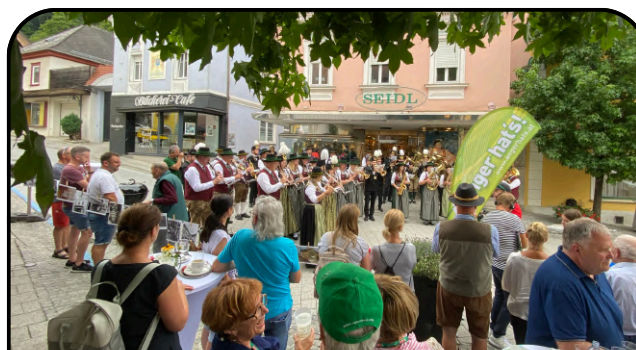
Heimatsommer in Anger