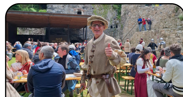
Veranstaltungen auf der Ruine Waxenegg