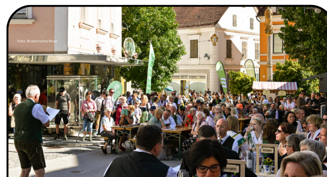
steirische Roas in Anger/Floing