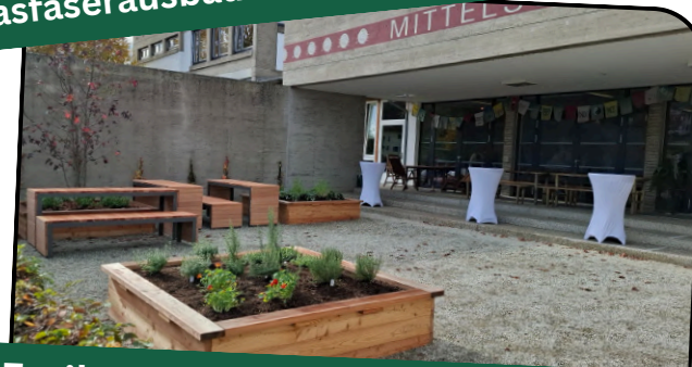
Freiluftklasse vor der Mittelschule