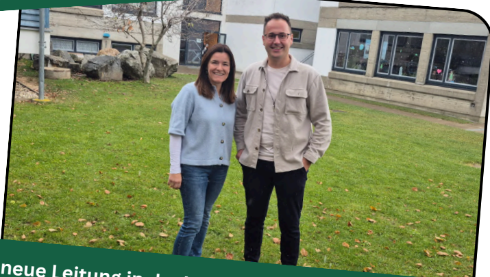
neue Leitung in der Volks- und Mittelschule Anger