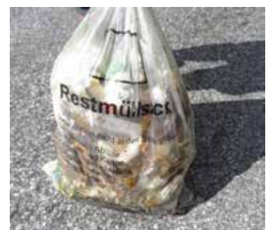
Bitte keinen Bioabfall im Restmüll entsorgen!