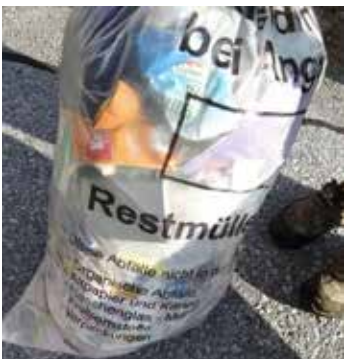
Der häufigste Fehlwurf: Leichtverpackungen für den Gelben Sack – auch die Chipstüte gehört dazu!

Bei unsachgemäßer Entsorgung von Abfällen über den Restmüll, sind deren Rohstoffe für ein weiteres Recycling verloren. Durch korrekte Trennung können diese jedoch als Sekundärrohstoff für neue Produkte wiederverwendet werden.