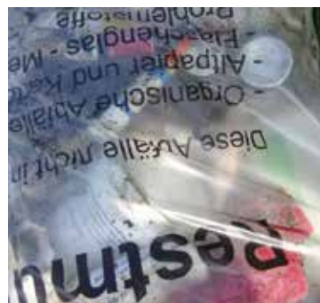
Metallverpackungen sowie Glasverpackungen gehören nicht in den Restmüll – bitte entsorgen Sie diese in den Containern vor dem ASZ!